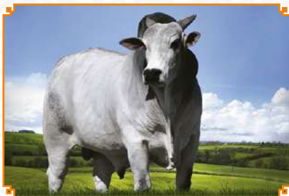
BHAN LEI NJOP (PAI)