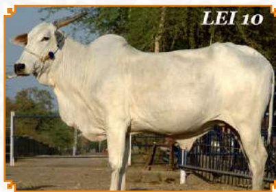
CHHELA - LEI 10 (BISAVÓ)