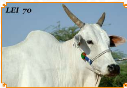
BHAVANI FIV LEI MATA VELHA - LEI 70 (BISAVÓ)