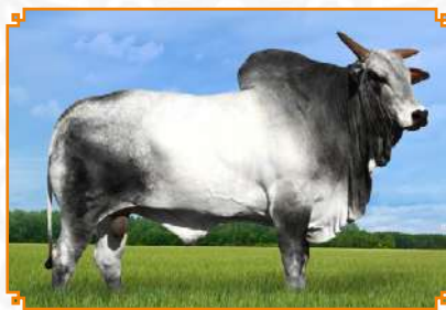
AVINASH TE LEI MATA VELHA (PAI)