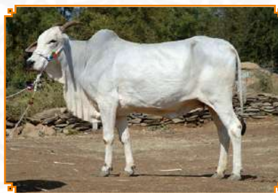
MUPPALA - LEI 104 (MÃE)