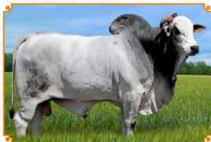
ETTAN LEI NJOP (PAI)