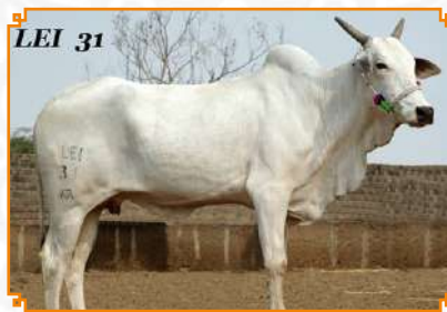
BHADIJA - LEI 31 (BISAVÓ)