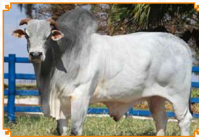
BAHULA LEI NJOP (PAI)