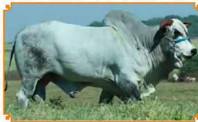
SHAKTI TE LEI MATA VELHA (PAI)