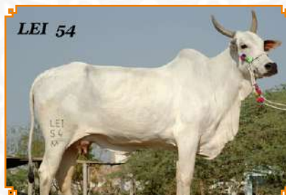
PARCHUR - LEI 54 (AVÓ)