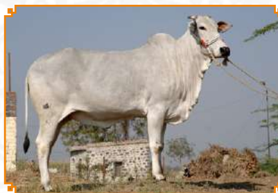
NANPALLI - LEI 90 (BISAVÔ)