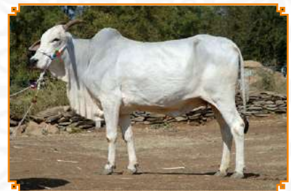
MUPPALA - LEI 104 (AVÓ)