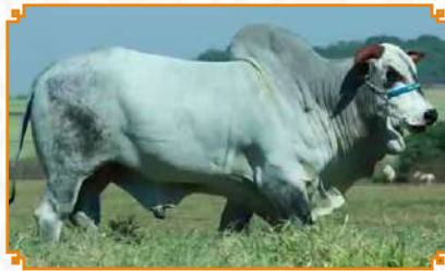
SHAKTI TE LEI MATA VELHA (BISAVÔ)