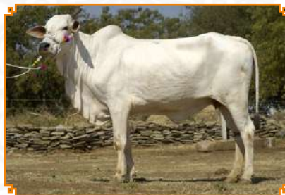
LAKSHIMI - LEI 103 (BISAVÓ)