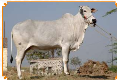
NANPALLI - LEI 90 (AVÔ)