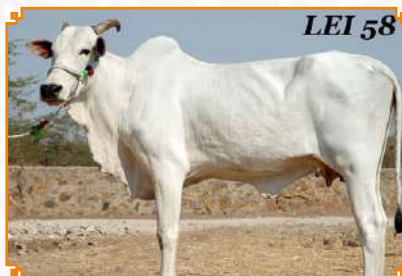
LADANAN - LEI 58 (MÃE)