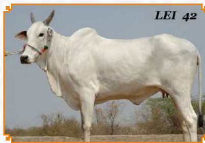
PHAVALIMA - LEI 42 (AVÓ)