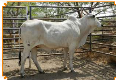
TIRUPATAMMA - LEI 143 (MÃE)