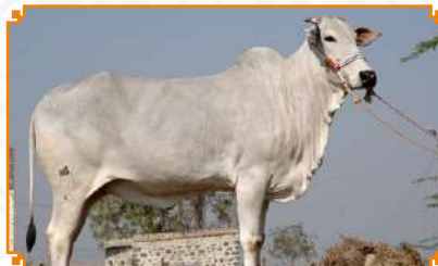
NANPALLI - LEI 90 (AVÔ)