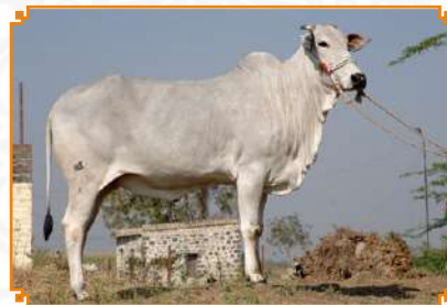
NANPALLI - LEI 90 (MÃE)