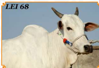
BHAGORIKANI - LEI 68 (BISAVÓ)