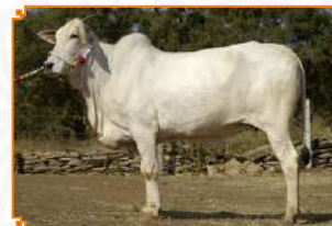
LAKSHIA - LEI 98 (BISAVÓ)