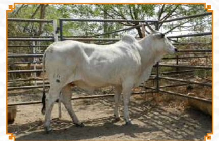
TIRUPATAMMA - LEI 143 (AVÓ)