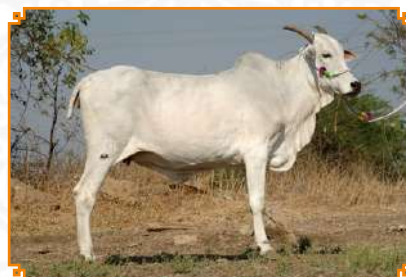
CHAKRA - LEI 111 (AVÓ)