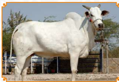
BHADJAR - LEI 36 (BISAVÓ)