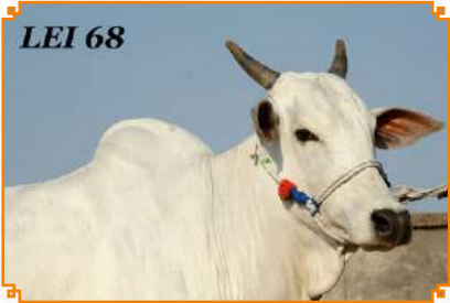
BHAGORIKANI - LEI 68 (MÃE)