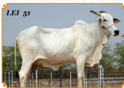
LADKY - LEI 51 (BISAVÓ)