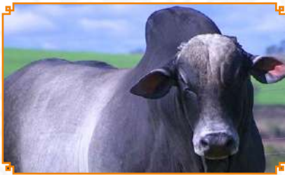
BEKA KAMAL LEI FIV (PAI)