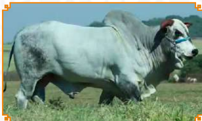
SHAKTI TE LEI MATA VELHA (AVÔ)