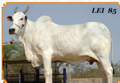
JANSI - LEI 85 (MÃE)